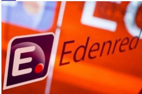
Edenred diventa partner di Percorsi di secondo welfare