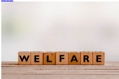
Costituzionalmente legittimo e strategico per lo sviluppo: il welfare aziendale secondo Treu