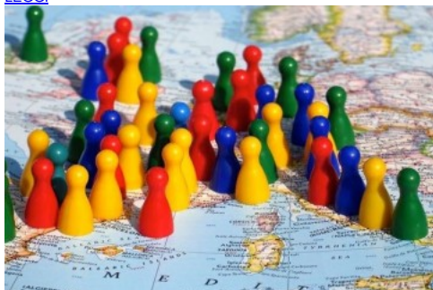
Le prospettive del welfare aziendale in Europa