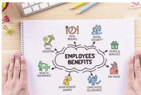
Retribuzione e welfare: cosa sta cambiando in Europa?