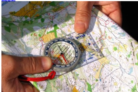
Una "nuova bussola" per il welfare aziendale: teoria e ricerche empiriche per passare all'azione